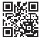
Unter 18nie! Keine Minderjährigen in der Bundeswehr