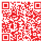
Pax Christi Bonn